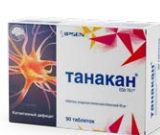
Таблетки 40 мг №90

РУ ЛП-№(002951)-(Р)-РУ от 11.04.2023 Танакан®