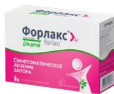
Порошок для приготовления раствора для приема внутрь 4 г №20

Относится к препаратам первой линии терапии запора 17-19 , помогает надолго восстановить естественную работу кишечника 20-22