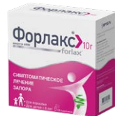
Порошок для приготовления раствора для приема внутрь 10 г №20