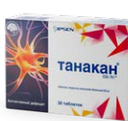
Таблетки 40 мг №30

Оригинальный препарат для симптоматического лечения – улучшает память и концентрацию внимания 15, 16